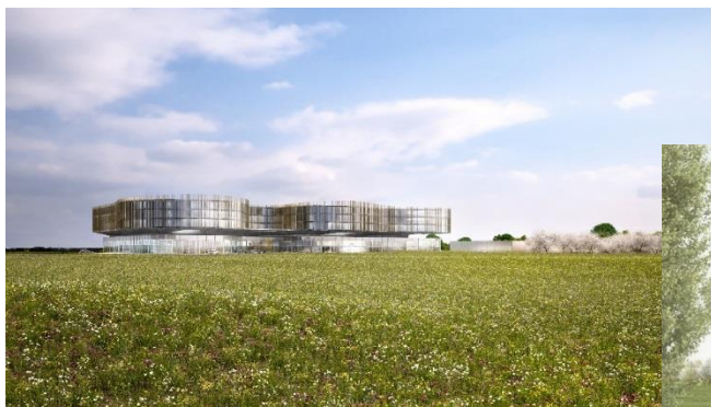
Vue extérieure © archipelago baev & Horoma

La « candidature » de Vivalia – comme celle des autres hôpitaux demandeurs de financement – est à présent analysée par l'AVIQ (Agence wallonne pour une Vie de Qualité), qui laissera le soin au Gouvernement wallon de prendre la décision de soutenir certains projets en les inscrivant dans son plan quinquennal.