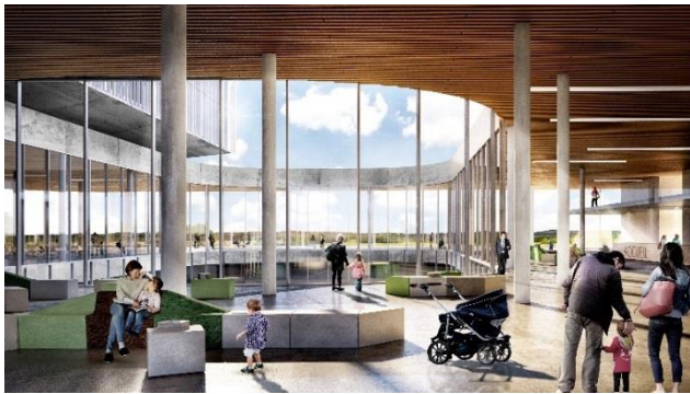
Vue intérieure