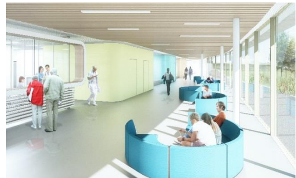
Entrée urgences