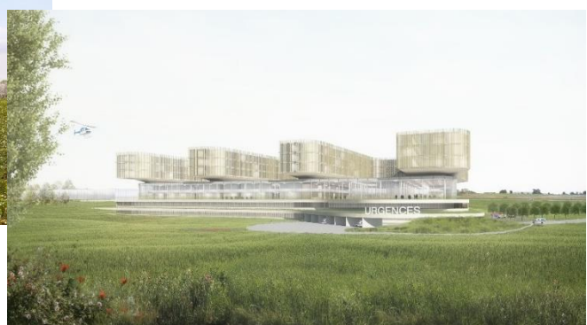
Façade arrière © archipelago baev